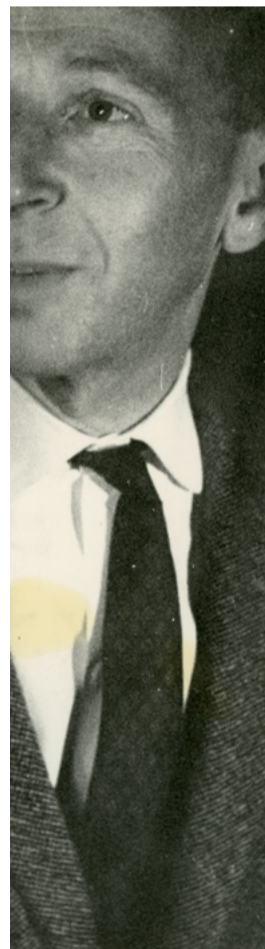
Robert Klein, photographie anonyme (détail), Bibliothèque de l'Institut national d'histoire de l'art, collections Jacques-Doucet, fonds Chastel © INHA