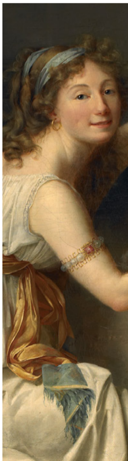
Romanée Adèle, Autoportrait présumé d'Adèle de Romanée dite Adèle Romanée ou Romani, 1793 ou Portrait de Mademoiselle Ducreux dit autrefois portrait de madame Vigée-Lebrun huile sur toile 176,5 x 130 cm