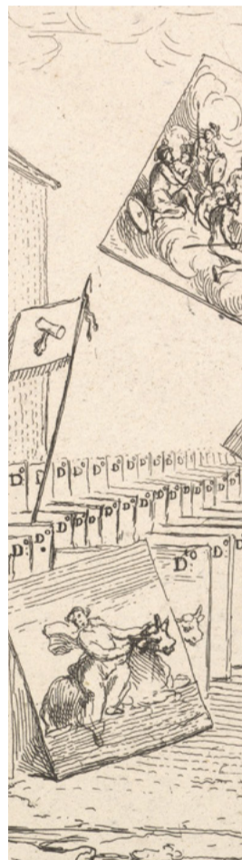
William Hogarth, The Battle of the Pictures (La bataille des images), gravure, 1745.