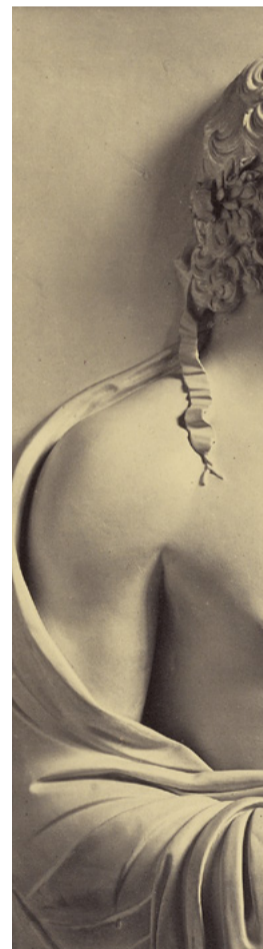
Intaille de la collection Stosch, dans J.J. Winckelmann, Monumenti antichi inediti, 2 volumes, Rome, 1767, pl.97.