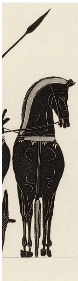
Robert Klein, photographie anonyme (détail), Bibliothèque de l'Institut national d'histoire de l'art, collections Jacques-Doucet, fonds Chastel © INHA