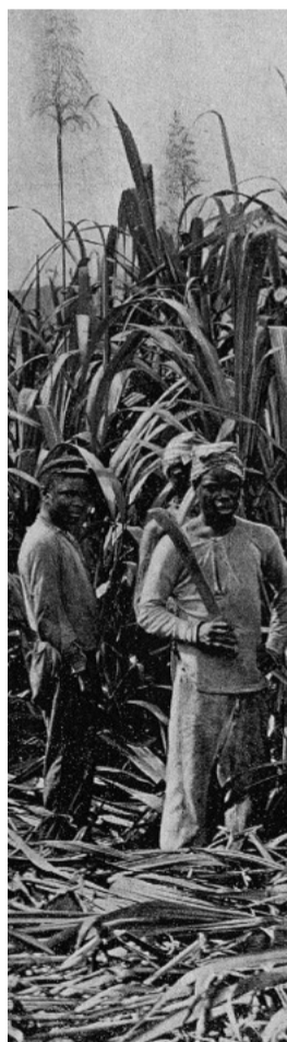
Portfolio colonial, dépeignant les paysages, les villes et les industries des possessions et dépendances françaises, ainsi que des pays qui, quoique n'étant pas effectivement sous notre protectorat, font néanmoins partie de la France coloniale en raison de leurs mœurs, leurs traditions et leur langage, photographies rassemblées par John L. Stoddard , Paris, The Werner Company de Chicago, 1895.