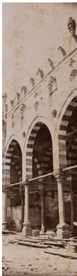
Beniamino Facchinelli, [Cour de la mosquée Altinbygha al-Maridani au Caire, avant 1887], tirée de Raccolta artistica di fotografie sull'architettura araba, ornati ecc. dal XII e al XIII e secolo fotografia italiana del Cav. B. Facchinelli , Cairo (Egitto) 1887, f o 114, bibliothèque de l'INHA

Manuels et livres d'échantillons des XVIII e et XIX e siècles en Languedoc et en Écosse