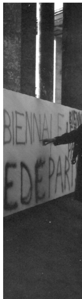
Robert César, Biennale de Paris, 1965, vue d'extérieur.