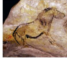
8. Images de chevaux de diverses phases du Paléolithique récent. a. Dessin de la grotte Chauvet (Ardèche), « salle du Fond », vers 35 000 avant le présent, longueur : environ 90 cm. b. Gravures à Ribeira dos Piscos, vallée du Côa (Portugal), vers 27 000 avant le présent, longueur du cheval entier : 60 cm. c. Dessin de la grotte de Niaux (Ariège), « Salon noir », vers 15 000 avant le présent, longueur : 72 cm.