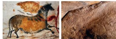
- 21 000 : Lascaux (Dordogne) et Trois-Pignons (Seine-et-Marne)