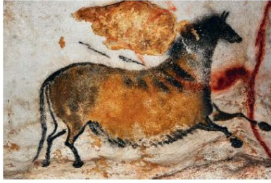
7. Fresque de la grotte de Lascaux (Dordogne) dans le « diverticule axial », vers 21 000 avant le présent, longueur : 130 cm.