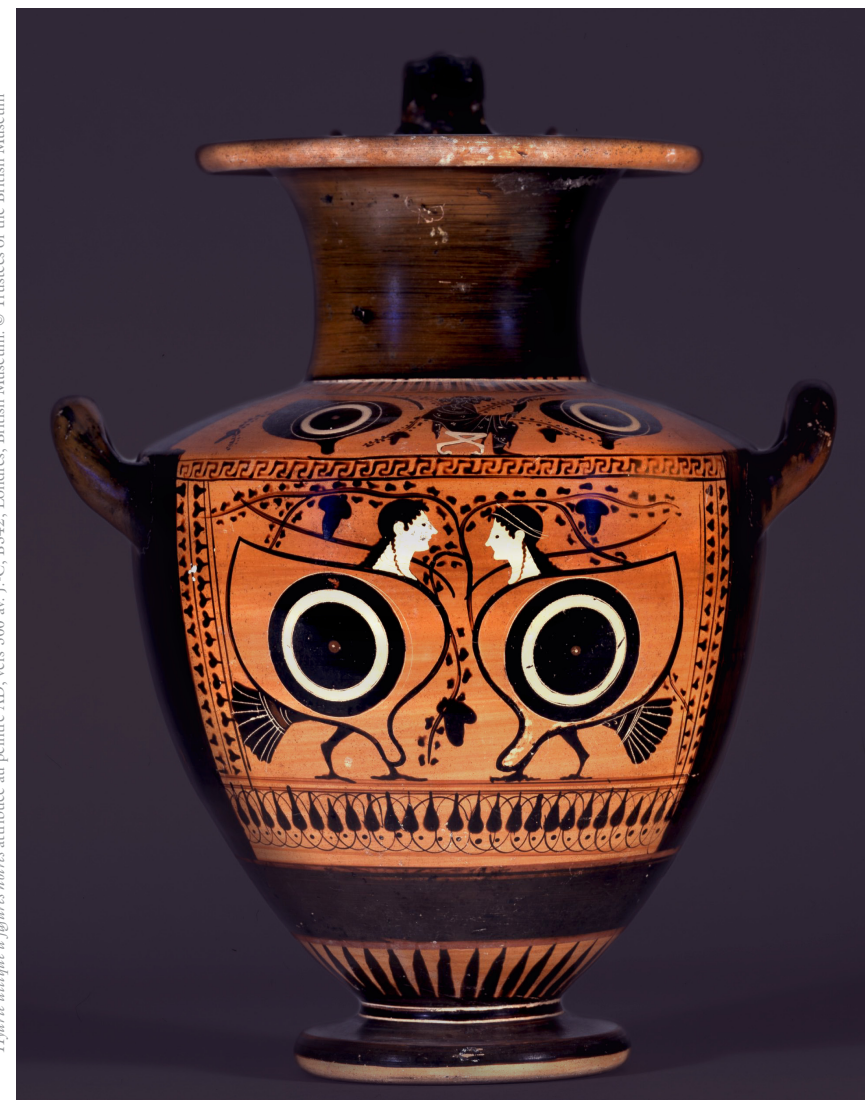
Hydrie attique à figures noires attribuée au peintre AD, vers 500 av. J.-C., B342, Londres, British Museum.

Institut national d'histoire de l'art Auditorium de la Galerie Colbert 2, rue Vivienne ou 6, rue des Petits-Champs – 75002 Paris Métro : Bourse ou Palais Royal – musée du Louvre Entrée libre dans la limite des places disponibles.